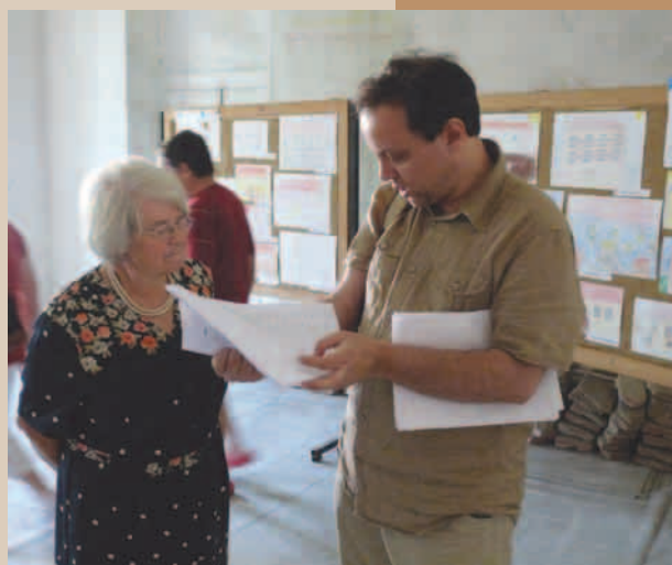
Projednávání - výtvarná soutěž