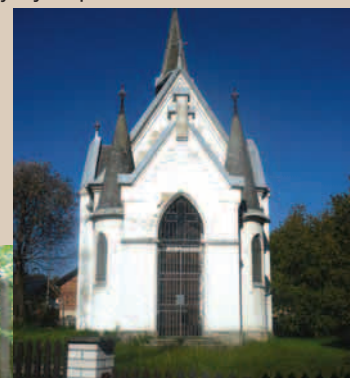
Pertoltice kaple sv. Prokopa