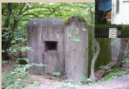
Nové Osinalice - bunkr

váno, kde jsou nové možnosti, které by však byly v logické návaznosti na stávající trasy, a co je potřeba k dalším krokům při zpracování studie. Zástupkyně obou místních akčních skupin poskytly zpracovateli při konzultacích díky svým znalostem místního prostředí cenné informace a bylo dohodnuto další společné setkání, které by se mělo uskutečnit ještě před koncem roku. S vývojem prací na studii zatím vládne spokojenost a všichni doufáme, že výsledkem bude skutečně užitečný materiál, který bude možné využít již ke konkrétním účelům, např. propojení turistických tras, vybudování odpočívacích míst.