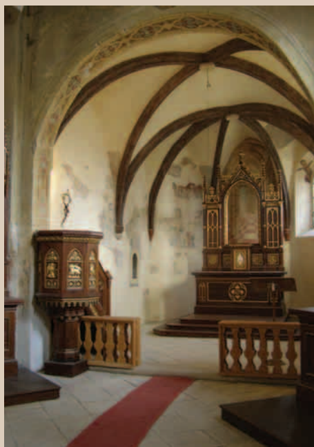
Interiér gotického presbytáře