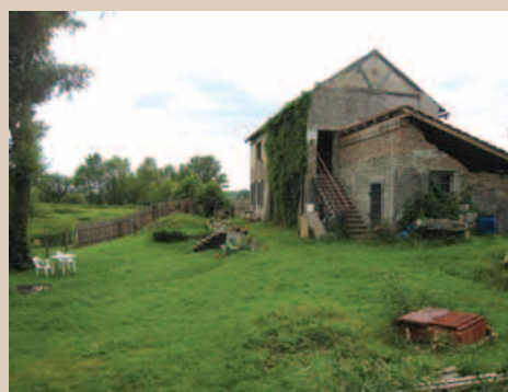
Bývalý dům převozníka

a byly vyhodnoceny možnosti pro vybudování stezek a zlepšení informovanosti nejen místních obyvatel, ale i návštěvníků z blízkého i dalekého okolí o kulturním dědictví venkova,