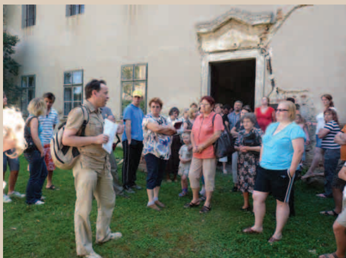
Veřejné projednávání studie

Celkové uznatelné náklady projektu 678 889 Kč poskytnutá dotace ve výši 611 000 Kč